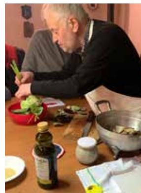
28 gennaio Casa degli Alpini, Lavarone

Incontro dei Cuochi dell'Alleanza della Lombardia e del Trentino, approfondimenti sull'olio extravergine, sulla rete Slow Grains e sui formaggi da prati stabili.