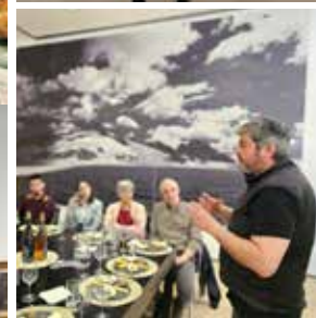
5 aprile MART, Rovereto In occasione dello Slow Art Day, cinque produttori trentini si sono cimentati con l'osservazione di due opere e con la loro interpretazione per mezzo delle proprie produzioni.