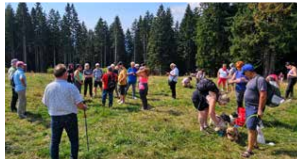
20 luglio Malga Millegrobbe