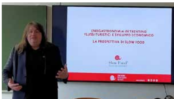
26 gennaio Liceo Rosmini, Rovereto

Incontro dedicato all'enogastronomia in Trentino.