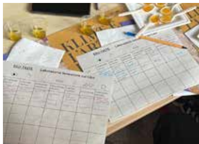
2 aprile Liceo Fabio Filzi, Rovereto

Laboratorio del gusto dedicato a Slow Food con gli studenti della 5 classe.