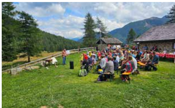
20 luglio Malga Covel Pejo

"Teatro in malga" è realizzato grazie al contributo della Fondazione Caritro legato al Bando per il volontariato culturale 2025 ed ha il patrocinio dell'Azienda per il turismo delle Valli di Sole, Peio e Rabbi. L'ingresso e la degustazione sono gratuiti, previa prenotazione.