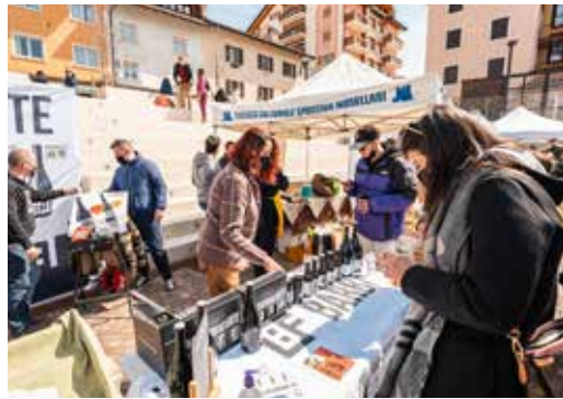
26 aprile Mercato della Terra a Folgaria

Congresso Slow Food Trentino Alto Adige APS, un momento per fare il punto sui lavori del 2024 e nominare il nuovo Consiglio direttivo dell'associazione.