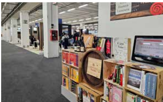
dal 27 al 29 ottobre Riva del Garda