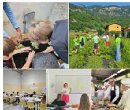
24 gennaio Giornata mondiale dell'educazione Una call alle scuole per aderire ai progetti dedicati alla formazione di Slow Food Trentino, dagli Orti scolastici ai Laboratori del gusto, dalle visite in aziende agli incontri con i Cuochi dell'Alleanza e con gli esperti.

Incontro dedicato all'enogastronomia in Trentino.