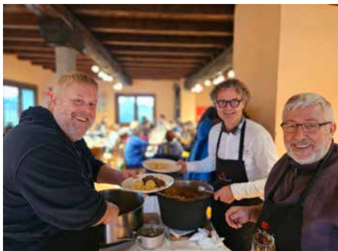
20 gennaio Agriturismo Cascina Santa Brera (Lombardia)

Incontro dei Cuochi dell'Alleanza della Lombardia e del Trentino, approfondimenti sull'olio extravergine, sulla rete Slow Grains e sui formaggi da prati stabili.