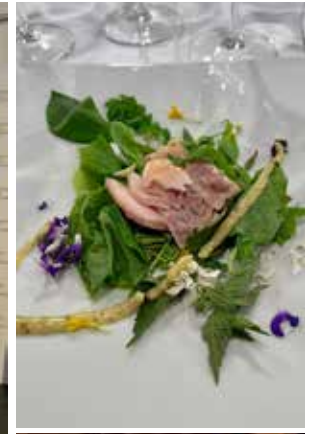
27 aprile Palazzo Roccabruna, Trento

Per il Trento Film Festival una serata dedicata al sistema Osterie e ai Cuochi dell'Alleanza del Trentino, con una tavola rotonda e una cena con Riccardo Bosco.