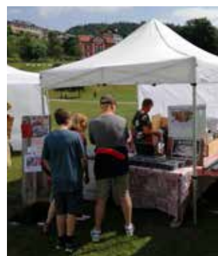
26 luglio Lago di Lavarone