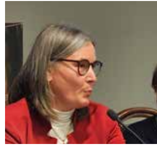
22 aprile Castello del Buonconsiglio, Trento

Congresso Slow Food Trentino Alto Adige APS, un momento per fare il punto sui lavori del 2024 e nominare il nuovo Consiglio direttivo dell'associazione.