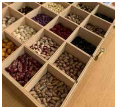
15 febbraio Casa degli Alpini, Lavarone