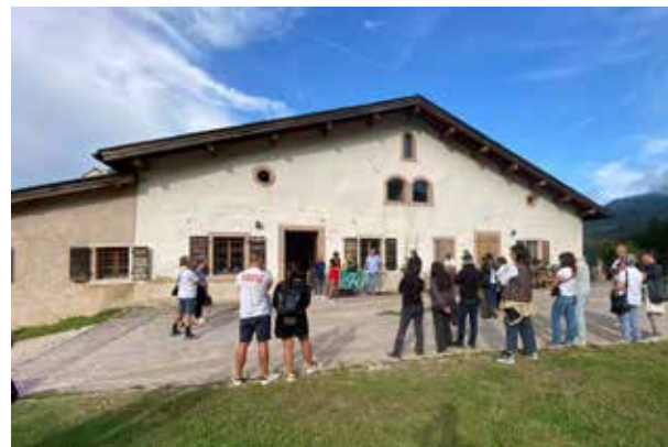
21 agosto Osteria Sant'Anna Sopramonte, Trento

Laboratorio Agricoltura di montagna e incontro con le ASUC del Bondone per festeggiare la premiazione con la bandiera verde.