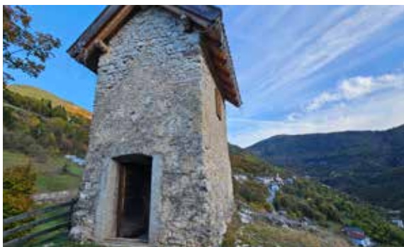
25 ottobre Mezzomonte, Folgaria

Nel corso del Festival del Reboro, un pranzo preparato dal Cuoco dell'Alleanza Fiorenzo Varesco.