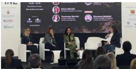
29 ottobre Riva del Garda

Per la prima edizione di FINE, fiera dell'enoturismo, uno spazio dedicato ai libri di Slow Food Editore sul vino e presentazione di una pubblicazione dedicata all'enoturismo nelle aziende Presidio Slow Food vitivinicole.