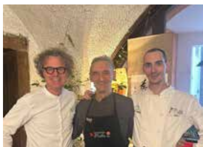
3 aprile Boivin, Levico

Laboratorio del gusto dedicato a Slow Food con gli studenti della 5 classe.