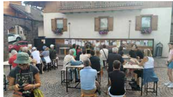
10 luglio e 31 luglio Palazzo Scoppoli, Tonadico

Quello del latte crudo è un tema su cui Pensarsi e agire come comunità, un tema che deve essere discusso in un nuovo e vitale spazio di confronto che riguarda gli ecosistemi, non territori delimitati da confini, uno spazio nuovo che non ha un sopra e un sotto, una dimensione nazionale e una territoriale. Abbiamo bisogno di uno spazio in cui mettere a terra una pluralità di competenze e esperienze di vita, ce lo richiedono le nuove geografie. Era stato richiesto al congresso di Genova, credo che oggi sia ancora più necessaria la sua costituzione per pensare insieme un'altra idea di mondo ogni giorno negli anni a venire”.