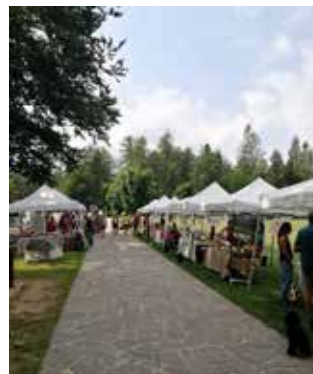
12 luglio Lago di Lavarone

Mercato della Terra e aperilibro con presentazione volume “Le Alpi in Fiamme. Navigare i monti nella crisi climatica”, con Slow Food Primiero APS.