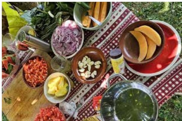
20 luglio Food Bridges Pergine

Al termine di un percorso di tirocinio e ricerca su Slow Food Kenya, un pranzo dedicato alla comunità kenyota residente in Trentino.