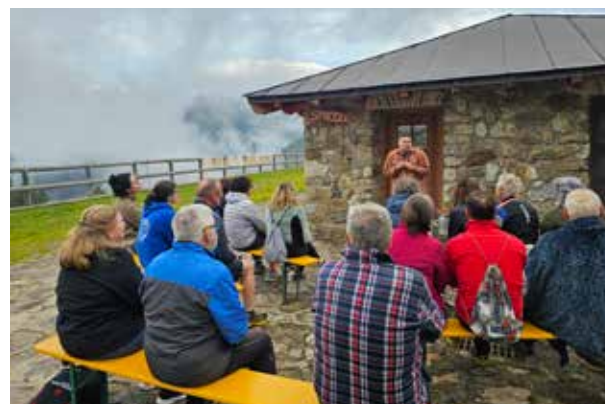
24 luglio Malga Preghena Valle di Bresimo

Mercato della Terra "Terre Alte" per la prima volta a Malga Millegrobbe.