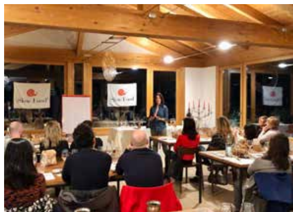
dal 30 ottobre Maso Martis e Maso Poli

Una cena dedicata al Presidio del miele di alta montagna alpina.