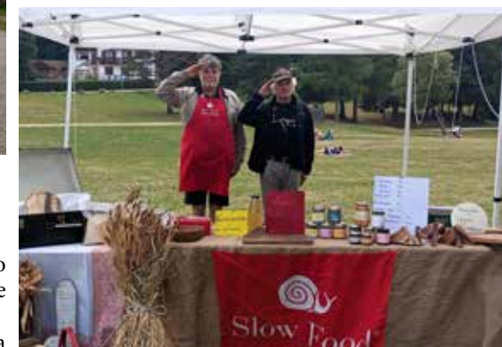
23 agosto Lago di Lavarone Mercato della Terra